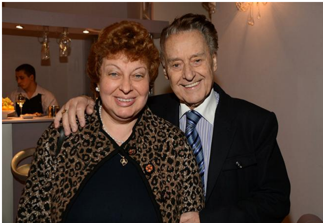
Поэт с супругой

Андрей Дмитриевич радует читателей и сегодня новыми произведениями. В 2016 году свет увидели сборники «Утро начинается с любви», «Любимые стихотворения в одном томе» и «Лебединая верность». Он по-прежнему ведёт радиопередачу «Вирази времени», колесит по миру с творческими встречами, каждый год занимает место почетного гостя на праздновании дня рождения «Дома поэзии Андрея Дементьева», который проходит в родном городе. Фестиваль собирает поэтов, писателей и артистов.