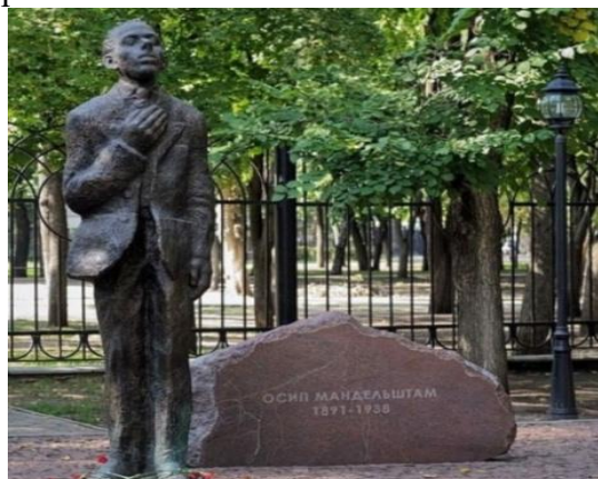
Памятник О. Мандельштаму в Воронеже

Его трагическая судьба до сих пор не оставляет равнодушными почитателей его творчества.