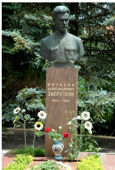
Памятник в станице Кочетовской.

станции Кочетовской на Дону во дворе дома, где он постоянно жил (сейчас там находится музей). В городе Ростове-на-Дону на улице Пушкинской установлен бюст писателю.